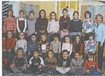
ÉCOLE JULES FERRY 2003 - 2004