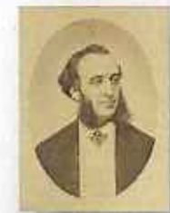
Jules Ferry (1832-1893)

contrôle et l'enseignement religieux sera dispensé en dehors des heures de classe.