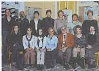
ÉCOLE JULES FERRY 2003 - 2004

Aujourd'hui, l'école Jules Ferry a été entièrement rénovée par la Municipalité ; elle est composée de 10 classes et fréquentée par 243 élèves ( rentrée 2012 ).